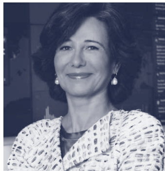
Dña. Ana Botín Presidenta de la Fundación CYD

El Informe CYD 2017 presenta de nuevo su análisis anual sobre el conjunto del Sistema Universitario Español y sobre sus universidades, poniendo especial acento en los ámbitos relativos a su contribución al desarrollo económico y social.